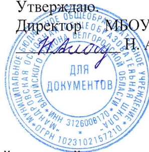
График посещения школьной столовой комиссией по контролю организации и качества питания на 2022-2023 учебный год